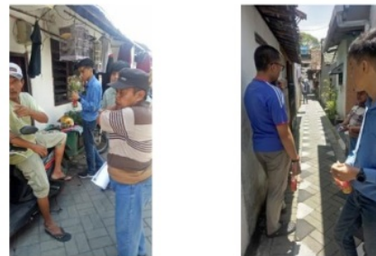
Gambar 2. Survei dan wawancara kepada Warga Kampung RT. 011 - RW. 06, Kel. Ngagel Rejo, Surabaya