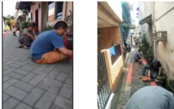
Gambar 3. Proses Bersih-Bersih dan Pengecatan Paving

Total waktu yang dibutuhkan dalam penyelesaian pengecatan ini sekitar 4 hari pengecatan atau 4 minggu penyelesaian (1 hari = 1 minggu) karena dalam satu minggu pengerjaan, Tim Pengabdian Masyarakat melakukan pengerjaan dalam satu hari saja. Sehingga penyelesaian pengecatan paving dan bersih-bersih kampung selesai pada tanggal 15 Mei 2019.