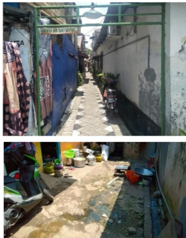
Gambar 1. Penampakan lingkungan

Total KK di kampung ini berjumlah 131 kk yang penduduknya semua sudah berkeluarga. Masing-masing rumah beranggotakan paling sedikit 4 orang, paling banyak sejumlah 8 orang dan rata-rata jumlah penduduk yang berjenis kelamin pria dan perempuan sama jumlahnya. Fasilitas umum di kampung ini juga terbilang minim yang dapat menunjang kegiatan sehari-hari warga yang tinggal disana karena lahannya yang sempit. Namun tetap permasalahan utama di kampung ini adalah masalah kebersihan dan penataan lingkungan yang kurang terjaga dari seluruharganya.