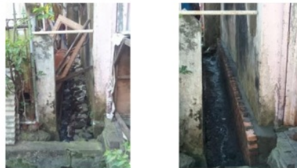
Gambar 5. Saluran Pembuangan Air yang belum dan sudah diperbaiki

Pelaksananya dilakukan di pagi hari karena membutuhkan waktu yang cukup lama untuk program kerja ini.