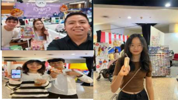
Dokumentasi Akhir Leblanc

Usaha parfum meluncurkan tiga varian parfum baru selama liburan yaitu Une , Deux , dan Trois . Pembuatan Harga Pokok Produksi (HPP) untuk varian baru dalam operasi ini sangat penting untuk menentukan harga jual yang kompetitif dan menguntungkan. HPP dihitung dengan memperhitungkan biaya bahan baku, overhead produksi, dan biaya tenaga kerja. Dengan menetapkan HPP yang tepat, Usaha parfum dapat menetapkan harga jual yang seimbang antara daya beli konsumen dan margin keuntungan yang diinginkan. Ini juga menjadi dasar untuk rencana diskon dan penjualan liburan lainnya. Strategi ini cenderung memungkinkan peningkatan volume penjualan.