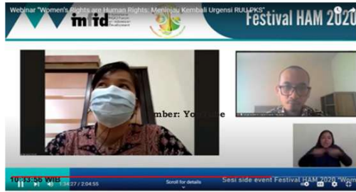
Gambar 4 Festival HAM 2020 oleh INFID

Terkait dengan sarana media alternatif bagi korban kekerasan seksual untuk angkat bicara, INFID bersama dengan Komnas Perempuan sudah lebih dulu menyediakan dan membuka sebuah forum kampanye. Namun sangat disayangkan jika sebagian besar orang yang ikut ambil bagian dalam kampanye tersebut adalah orang-orang yang minim pengetahuan atau wawasan khususnya dalam lingkup kekerasan seksual itu sendiri sehingga kampanye ini tidak dapat fungsional dan banyak pihak yang terkesan menolak hadirnya keberadaan forum kampanye tersebut.