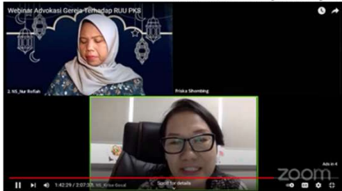
Gambar 5 Webinar Advokasi Gereja terhadap RUU PKS

Kelompok advokasi yang digerakkan oleh gereja juga berpendapat serupa. Dalam webinar yang diselenggarakan Pelayanan Komunikasi Masyarakat-Persekutuan Gereja-gereja di Indonesia (Yakoma-PGI), kelompok advokasi gereja menjadi kanal yang mewacanakan perspektif bahwa kekerasan seksual yang kebanyakan timbul ini disebabkan ketidaksetaraan yang menempatkan perempuan sebagai pihak yang lebih inferior. Minimnya pengetahuan masyarakat tentang persoalan relasi kuasa dalam kaitannya dengan gender juga menyebabkan terjadinya ketimpangan pada perempuan dan juga tidak menutup kemungkinan dialami pada anak yang rentan menjadi korban kekerasan seksual. Dalam forum "Webinar Advokasi Gereja terhadap RUU PKS" yang diselenggarakan Yakoma-PGI tersebut, mayoritas partisipan adalah perempuan yang sebelum hadir telah memiliki kesadaran penuh tentang urgensi RUU PKS.