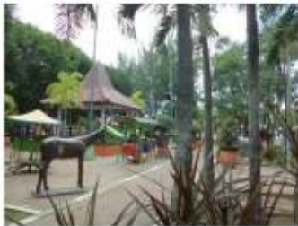
Gambar 15. Playground, sebagai fungsi baru yang masuk ke dalam Alun-alun Jember.

Alun-alun yang berada di tengah kawasan ini, dahulu merupakan ruang kosong (berupa hamparan rumput dengan beberapa pepohonan), yang hanya sesekali saja dipakai bila ada acara publik seperti pesta rakyat, atau untuk upacara.