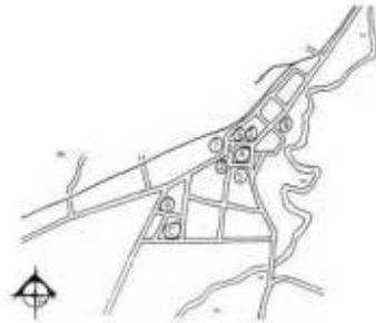
Gambar 2. Alun-alun Jember di masa Kolonial Belanda

dengan the system of enterprise . Sistem baru dari pemerintah Hindia-Belanda ini memberikan dukungan dan fasilitas kepada pihak swasta dengan tujuan agar hasil tanaman komoditi ekspor dapat memberikan keuntungan atau devisa bagi pemerintah Hindia-Belanda.