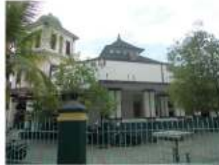
Gambar 8. Masjid Lama tajug di sebelah barat Alun-alun Jember.

Sedangkan sumbu yang kedua adalah masjid baru berupa masjid modern yang dibangun sejak tahun 1978, dengan atap shell besar yang menjadi ikon baru di sebelah barat alun-alun Jember sampai sekarang ini.