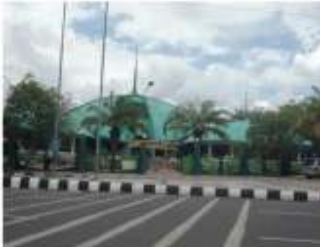
Gambar 9. Masjid Baru berbentuk shell di sebelah barat Alun-alun Jember.