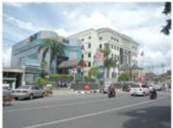
Gambar 11. Sisi Timur Alun-alun Jember dengan gedung-gedung Bank yang berupa hi-rise building (bertingkat tinggi)