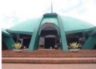
Gambar 13a dan 13b. Hybrid antara masjid tajug dan mesjid shell di sisi barat Alun-alun Jember.