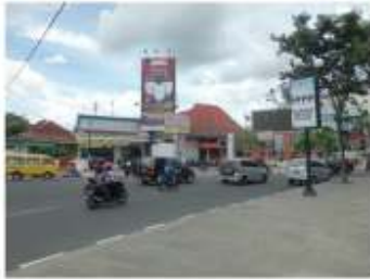
Gambar 10. Sisi Utara Alun-alun dengan berbagai macam bangunan, baik bentuk maupun fungsinya.

Bagian sisi utara merupakan sisi yang paling dinamis disporanya saat ini. Di sini tidak ada bangunan yang dominan, dan lebih terlihat sebagai kumpulan massa-massa bangunan yang berderet dan berasal dari masa (waktu) pembangunan yang berbeda-beda tetapi tidak berurutan, membentuk sebuah perjalanan historis yang acak ( random ).