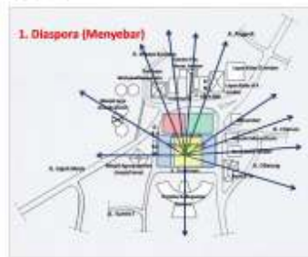
Gambar 5. Peta Diaspora Kawasan Alun-alun kota Jember

sehingga mempengaruhi budaya di tempat-tempat yang mereka duduki (jajah).