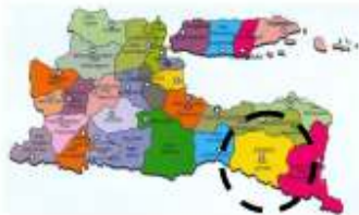
Gambar 1. Peta Jawa Timur

Kota Jember merupakan sebuah kota di Jawa Timur bagian timur yang pada awalnya dibentuk oleh pemerintah Belanda di jaman kolonial, dan dalam perkembangannya akhirnya menjadi ibukota dari kabupaten Jember sampai sekarang ini. Kota ini berkembang dari nol, dan berkembang karena banyak pendatang yang ingin mengubah kehidupan (Adisasmita, 2010), dibentuk oleh proses migrasi (Hariyono, 2007). Jember adalah salah satu kota yang cukup penting di Jawa Timur baik secara budaya, ekonomi dan politik, antara lain terbukti dari adanya perguruan tinggi negeri (Universitas Jember), juga adanya bandar udara (bandara) yang menghubungkan Jember dengan Surabaya, bahkan Jember juga punya agenda kreatif yang sudah menjadi agenda Internasional, yaitu JFC ( Jember Fashion Carnival ). Selain itu, Jember juga menjadi daerah dalam fase peralihan yang dinamis, yang berada antara desa dan kota (Pontoh dan Kustiwan, 2009)