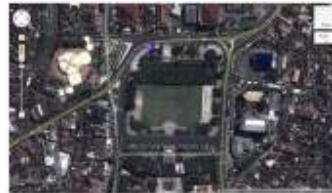
Gambar 3. Kawasan Alun-alun Jember di masa Sekarang

Seperti halnya kota-kota lain di Jawa, Jember juga memiliki sebuah Alun-alun kota yang punya ciri khas dan karakteristik tersendiri, sekaligus juga sebagai identitas kota Jember. Sebagai sebuah landmark kota, Alun-alun Jember juga menjadi representasi dari proses penguasaan dan penaklukan, pertentangan budaya, perbedaan paham dan kelas, juga jejak dan bibit kota kreatif yang terjadi sejak masa penjajahan Belanda hingga saat ini.