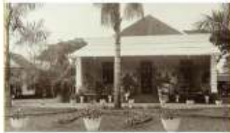
Gambar 6. Kantor Regentschap (Kantor Asisten Residen) Jember pada masa Kolonial Belanda.

Saat ini, bagian selatan adalah bagian yang paling konsisten dengan satu fungsi, yaitu sebagai kantor pusat Pemerintah Kabupaten Jember beserta kantor-kantor penunjangnya.