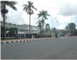
Gambar 7. Kantor Pemkab Jember di masa sekarang.

Itupun sudah bukan satu massa bangunan saja seperti pada masa kolonial dulu, tetapi ada banyak massa yang berada di belakang (di sebelah selatan) bangunan utama. Penambahan