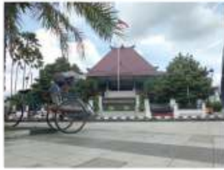
Gambar 14a dan 14b. Hybrid antara bangunan komersial dan bangunan birokratis di sisi utara Alun-alun Jember