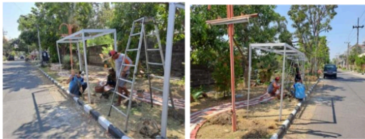
Gambar 4. Pemasangan Gawangan Pada Lokasi Taman Warga

itu proses ini juga sebagai percontohan bagi warga apabila ingin mencontoh dan mempraktekkan sendiri di halaman atau teras rumah masing-masing. Jadi secara sitem proses budidaya, bibit tanaman anggur yang sudah dilakukan penyemaian dalam tahap pembibitan kemudian dipindahkan ke media tanah taman untuk dirambatakan pada gawangan media tanam. Sehingga ada runtutan tata cara dari pola kegiatan pengabdian kepada masyarakat sebelum tanaman anggur dibudidayakan untuk proses pemuahan akan mengalami terlebih dahulu tahap pembibitan.