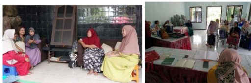
Gambar 8. Penyuluhan Kegiatan Abdimas kepada Warga

dapat belajar menjadi seorang enterpreunership dalam bidang pertanian anggur untuk lingkungan perkotaan mulai dari proses pembibitan hingga masa panen yang hasilnya dapat dijual untuk membantu meningkatkan penambahan ekonomi masing-masing warga. Untuk dampak secara sosial, dalam pelaksanaan budidaya tanaman anggur warga masyarakat dapat bersama-sama mempelajari dan saling berdiskusi terkait segala persoalan mengenai bidang pertanian khususnya tanaman buah. Selain itu warga juga turut terlibat dalam proses pembangunan seluruh sarana dan prasarana untuk media tanam berupa gawangan yang terbuat dari rangka baja ringan/ galvalum . Sebagai harapan kedepan perumahan Babatan Pilang dapat menjadi lingkungan binaan dari prodi Arsitektur Universitas Katolik Darma Cendika.