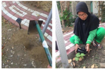
Gambar 7. Proses Penanaman Bibit Anggur

Kegiatan pengabdian kepada masyarakat melalui pendampingan pembuatan media tanam budidaya tanaman anggur sangat diperlukan oleh warga yang bertempat tinggal di Perumahan Babatan Pilang RT. 002. Terlebih perumahan ini berada di wilayah kota Surabaya yang lokasinya sulit untuk mencari tempat bercocok tanam sehingga memerlukan suatu konsep khusus dalam pelaksanaannya. Urban farming sangat cocok dan sesuai bila dilaksanakan dalam lingkungan yang sempit dan padat akan penduduk. Konsep ini layak digunakan untuk menanggulangi keterbatasan lahan disebuah wilayah atau kota. Dalam dampaknya secara ekonomi, warga dapat mempelajari cara membudidayakan jenis tanaman anggur dan dapat dipraktikkan dilingkungan rumah masing-masing untuk menunjang keberlangsungan urban farming ditengah padat dan minimnya jumlah lahan terbuka. Warga masyarakat