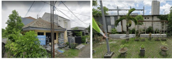
Gambar 1. Lokasi rencana kegiatan abdimas urban farming

mengetahui mulai dari proses pembibitan hingga pemetikan hasil dari buah tanaman anggur yang telah ditanam.