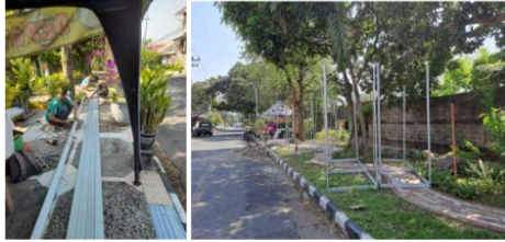
Gambar 3. Perakitan Sarana Prasarana Gawangan Tanaman Anggur

siap panen. Hal ini dikarenakan untuk membedakan dan memfokuskan serta memilah antara bibit anggur dengan tanaman anggur siap panen.