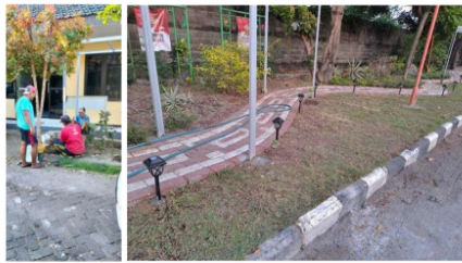
Gambar 5. a) Pemasangan Gawangan pada Lokasi Balai RT; B) Penanaman Bibit Tanaman Anggur Hasil Budidaya

utama dari sarana dan prasarana tanam berupa gawangan dikarenakan material ini mudah dalam proses fabrikasi/perakitannya hingga tahan terhadap cuaca (bebas karat) serta hama seperti rayap. Secara desain, gawangan memiliki empat penyangga kaki sebagai struktur kolom utama dan sebagai rambatan utama secara vertikal. Selain itu digunakan juga material kawat aluminium pada bagian atas gawangan sebagai rambatan utama untuk tanaman anggur secara horisontal.