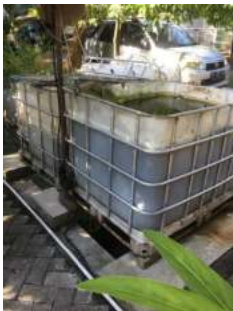
Gambar 6. Hasil pembuatan kolam ikan fiber bersama warga

Area pengerjaan paving sendiri memiliki luasan 45\text{m}^2 . Celah antar paving diberikan pasir untuk melekatkan atau memadatkan paving yang telah terpasang.