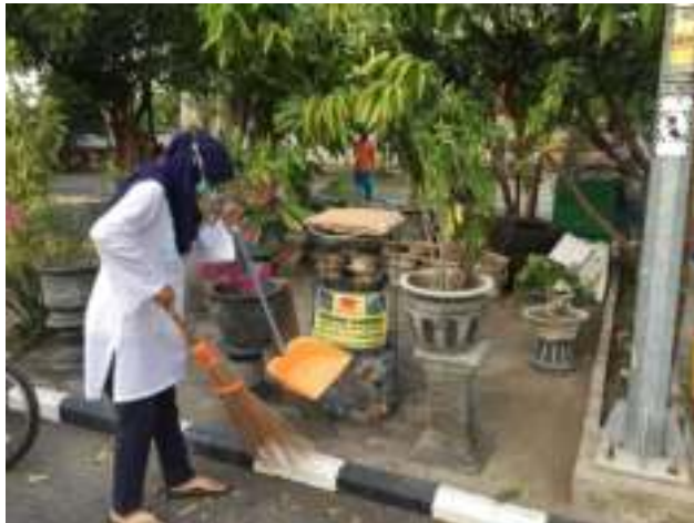
Gambar 5. Pembersihan lokasi setelah paving terpasang

Selain area bermain yang dikerjakan dalam bentuk pekerjaan pavingisasi , juga dilakukan pemilihan tempat untuk menentukan peletakkan kolam ikan. Seluruh kegiatan pembuatan kolam ikan dan pavingisasi area bermain ini akan dikerjakan bersama-sama. Seluruh kegiatan pengabdian ini juga dilakukan pembelian bahan dan material sebelumnya guna mendukung terlaksananya dan terciptanya suasana yang diinginkan. Pemasangan paving diawali dengan pekerjaan perataan dasar paving menggunakan pasir padat. Kemudian dilakukan pekerjaan pemasangan paving pada area yang sudah di tentukan.