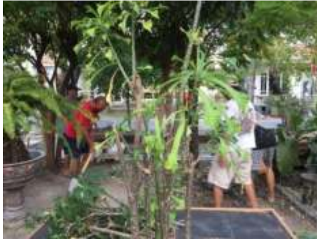
Gambar 2. Tim pengabdian bersama warga melakukan persiapan lokasi

Persiapan ini dilakukan mulai dari pembersihan lokasi pada lahan eksisting dan konsolidasi titik awal pengerjaannya bersama warga sekitar. Selain itu juga dilakukan pemikiran bersama terkait alat bermain bagi warga yang diinginkan namun ramah terhadap anak-anak.