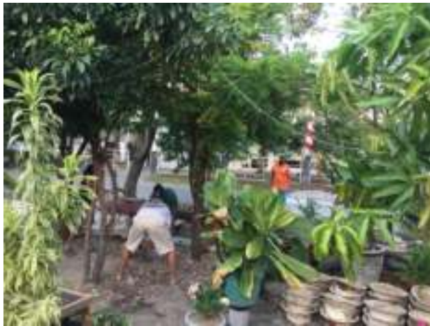
Gambar 3. Perataan lokasi dan pemadatan pasir sebagai media paving