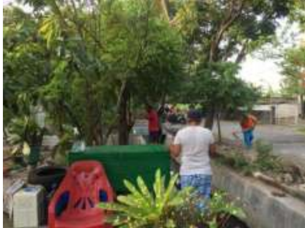
Gambar 4. Penataan area yang akan di- paving