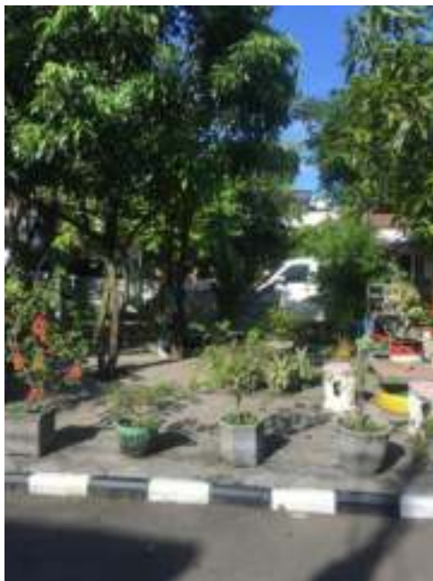
Gambar 7. Hasil pemasangan paving lingkungan

pilihan jenis ikan kepada pedagang apabila hasil ternak tersebut dijual. Selain itu kolam juga dilengkapi dengan sistem filter air untuk menjaga kebersihan dan pH dari air kolam tersebut.