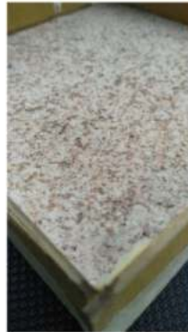
Gambar 6. Hasil Campuran Adonan Plafond Komposit

memiliki kemampuan peredaman suara yang semakin bagus apabila prosentase campuran serbuk kayu semakin besar (Nurmaidah & Purba, 2017).