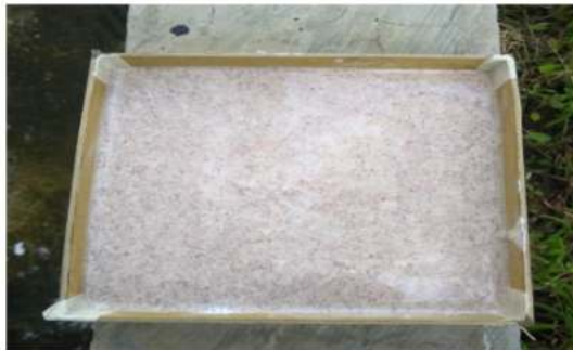
Gambar 2. Papan Alas Modul Material

Dengan menggunakan metode experimental , dilakukan terlebih dahulu pengumpulan bahan material. Bahan yang digunakan yakni serbuk kayu, semen putih, lem perekat, dan cetakan karton. Sedangkan alat bantu yang digunakan yakni penampakan, sendok dan alat cetak plafon. Tahap ini dilakukan penelitian lebih lanjut mengenai variasi serat pada jumlah semen putih, perekat serta serbuk kayu yang dicampurkan untuk membuat plafon berbahan dasar serbuk kayu daur ulang. Bahan tersebut terdiri atas serbuk kayu yang terdiri atas 100 gram, semen putih 100 gram dan perekat lem putih 100 gram. Dari hasil penelitian plafon yang terbentuk dari serbuk kayu memiliki kekuatan lebih baik jika perekat serta semen putih memiliki campuran lebih banyak sehingga membentuk suatu kelenturan dan daya tarik yang baik. Material serbuk kayu sebagai material utama memiliki sifat yang paling baik dalam pengujian kekerasan dan kuat tarik apabila dipadukan dengan material lainnya dalam pembuatan material papan komposit (Mulana et al., 2011). Pada tahap persiapan bahan serbuk kayu dibersihkan dari kotoran-kotoran, kemudian serbuk kayu diayak menggunakan ayakan yakni 10 mesh serta serbuk kayu yang tersaring akan digunakan sebagai bahan dasar pembuatan plafon berbahan dasar serbuk kayu olahan. Papan komposit yang memiliki bahan dasar serbuk kayu umumnya dipengaruhi dari panjang serat dan volume (Sulistiyowati et al., 2015).