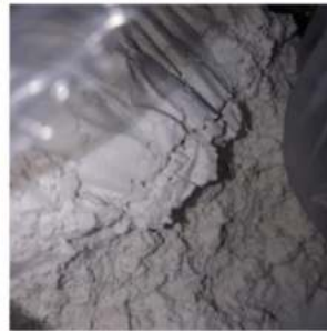
Gambar 4. Semen Putih