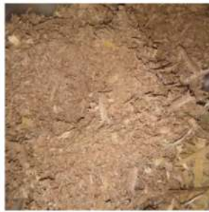
Gambar 3. Serbuk Kayu

Pada pembuatan plafon berbahan dasar serbuk kayu tersebut yang telah disaring dengan menggunakan ayakan kembali ditimbang beratnya sesuai kebutuhan dalam pembuatan plafon berbahan dasar serbuk kayu. Kemudian serbuk kayu yang telah disaring menggunakan ayakan dicampur semen putih dicampurkan ke serbuk kayu sehingga membentuk suatu campuran sampai merata dengan ditambahkan air secukupnya, setelah itu semen putih dan serbuk kayu diaduk, dicampur sampai merata, sehingga membentuk sebuah adonan campuran serbuk kayu yang lengket dengan semen putih. Adonan yang sudah terbentuk tersebut dari semen putih serta serbuk kayu. Adonan yang sudah terbentuk tersebut dicampurkan dengan menggunakan perekat lem putih kemudian di adonan sampai merata sehingga lem putih bercampur dengan adonan yang tersusun dari semen putih serta serbuk kayu yang telah tercampur. Perekat lem putih memiliki tujuan agar campuran lebih rekat dan daya kuat lentur yang baik. Massa campuran atau adonan tersebut kemudian diratakan pada cetakan tersebut sehingga rata. Pemerataan campuran bahan tersebut menggunakan permukaan yang rata sehingga membentuk persegi seperti plafon.