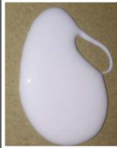
Gambar 5. Lem Putih

Pada plafon yang terbuat dari serbuk kayu tersebut memiliki beberapa keunggulan dalam penggunaannya dalam pemakaian terhadap rumah tinggal yakni dengan penggunaan plafon komposit serbuk kayu tersebut memberikan suhu yang optimal terhadap ruangan yang dihuni tersebut. juga dampak positif dalam penggunaannya (Kho, 2014). Ruangan yang dingin tentu saja memberikan manfaat kenyamanan pada penghuni yang tinggal serta ketinggian plafon tersebut (Purwanto, 2009). Limbah kayu dalam bentuk serbuk gergaji