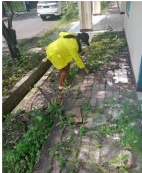
GAMBAR 2 PEMBERSIHAN LINGKUNGAN JALAN