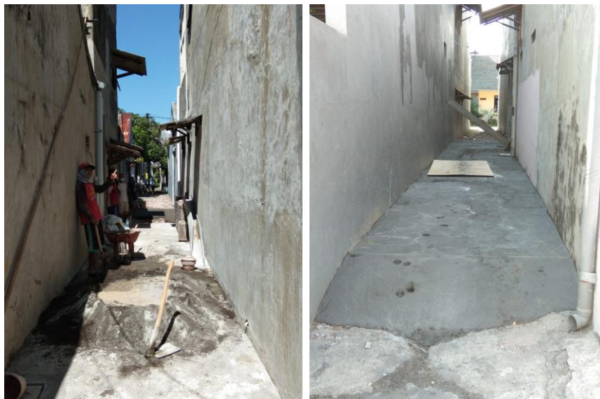
Gambar 3. Pengecoran Brandgang

Agar mendapatkan kualitas yang baik, mutu cor harus juga dijaga meskipun kegiatan ini hanya bersifat mikro. Dikatakan mikro karena kegiatan pengabdian masyarakat hanya berfokus pada area brandgang yang memiliki panjang 30 meter dan lebar 2 meter. Untuk mendapatkan mutu yang bagus diperhatikan pula campuran cor yang terdiri dari semen, pasir dan kerikil dengan agregat 1Ps:3Ps:5Kr. Hal ini dikarenakan brandgang juga sering dilalui oleh para pejalan kaki dan sepeda motor, sehingga kualitas hasil pekerjaan juga harus dijaga.