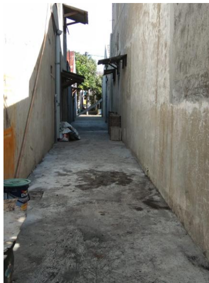
Gambar 5. Hasil akhir pekerjaan jalan brandgang

kedalam agenda kegiatan pengabdian masyarakat. Jalan brandgang dapat kembali difungsikan setelah 1 minggu dengan membuka akses dikedua sisi jalan. Diharapkan dengan adanya peremajaan brandgang ini pengguna dapat dengan aman dan nyaman melewati jalan ini untuk mempercepat aktivitas terutama bagi pejalan kaki karena jalan brandgang dapat berfungsi sebagai shortcut .