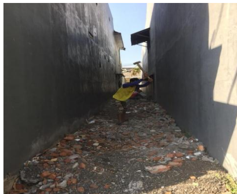
Gambar 1. Pemecahan dan Perataan Gragal

Proses pengerjaan peremajaan brandgang ini sesuai jadwal yang sudah ditetapkan dan disosialisaikan bersama dengan warga yaitu selama 2 minggu. Setelah semua didapatkan kesimpulan dari hasil rapat bersama Ketua RT dan beberapa warga, kemudian mulai dilakukan kegiatan utama dari pengabdian kepada masyarakat. Dimana pengerjaan dimulai dengan mendatangkan urugan berupa gragal yang berfungsi sebagai pemadatan dan pondasi jalan brandgang . Urugan gragal disebar secara merata diseluruh area yang dikerjakan agar kualitas jalan menjadi lebih kuat dan tahan lama. Gragal ini didapatkan dari bongkaran proyek rumah yang ada disekitar lingkungan Babatan Pilang. Sehingga pemanfaatan material masih bisa digunakan lagi guna menjaga konsep sustainable .