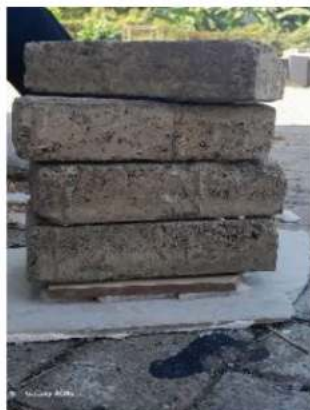
Gambar 5. Menyatukan keramik dan gabus