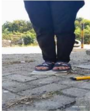
Gambar 6. Memberikan beban keramik dengan tumpuan kaki