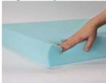
Gambar 3. Material gabus

Gabus memiliki karekteristik ringan dan umumnya banyak digunakan sebagai material untuk isolasi termal atau akustik. Gabus memiliki sifat yang baik dalam meredam suara dan menjaga suhu dalam bangunan. Penggunaan gabus sendiri diaplikasikan pada area dalam dinding atau plafon untuk meningkatkan kenyamanan akustik dan termal.