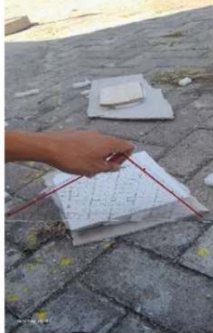
Gambar 7. Mengukur tingkat penurunan gabus

Dalam proses pemanfaatan komposit material antara keramik dan gabus kita di tuntut untuk menghasilkan pembaharuan material yang mampu menyerap suara kebisingan dengan mengurangi rambatan suara. Karena dalam pemanfaatannya gabus yang bagus adalah gabus yang memiliki permukaan yang empuk dan halus. Akan tetapi, kita bisa juga untuk memanfaatkan semua jenis gabus sebagai bawahan keramik.