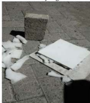
Gambar 4. Paving sebagai material tekan gabus terhadap keramik