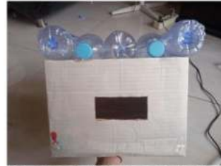
Gambar 2. Modul ruang karton

Dibuat juga modul ruang dalam skala kecil dengan menggunakan kardus karton bekas yang dibentuk kubus dengan ukuran 24,5x27,5x20,5. Modul ruang kubus ini diibaratkan sebagai sebuah ruang dalam bangunan yang nantinya akan mendapatkan penutup tambahan atap kaca dan botol plastik bekas. Penutup tambahan itu akan diletakkan tepat berada di atas modul ruang kubus yang kemudian dilakukan perhitungan perbandingan terhadap 2 jenis material ini terkait suhu ruang dalam yang didapat.