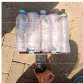
Gambar 4. Perhitungan suhu modul dalam ruang plastik bekas