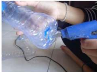
Gambar 1. Pengeleman botol plastik bekas

bagian dalam rumah yang berfungsi sebagai daylight . Namun panas radiasi matahari yang masuk ke dalam sebuah ruang dengan menggunakan atap jenis tersebut membuat suhu dalam ruang sebuah bangunan menjadi meningkat (panas). Terlebih seperti pada area carport , dimana kondisi kendaraan yang terparkir akan tetap panas dan tidak terlindungi sepenuhnya dari radiasi sinar matahari. Sebagai percobaan atau eksperimen yang dilakukan perlu alternatif material dengan perbandingan yang kurang lebih serupa sebagai pengganti material kaca dengan karakteristik transparan dan tembus pandang namun hemat energi dan ramah lingkungan serta mampu mereduksi panas radiasi sinar matahari. Material yang dipilih yakni limbah bekas dari botol plastik. Modul percobaan yang dipakai yaitu dengan 5 buah botol plastik yang disatukan antara yang satu dengan yang lainnya. Uji coba yang dilakukan secara eksperimen ini dengan menyatukan beberapa buah botol plastik bekas dengan cara dilem dan saling direkatkan.