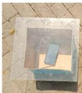
Gambar 5. Perhitungan suhu modul dalam ruang kaca