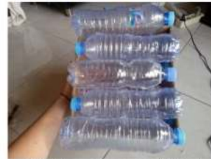
Gambar 3. Penyatuan modul karton dan bidang plastik botol bekas

Pada proses pengukuran suhu tersebut dilakukan perbandingan antara kedua buah jenis material kaca dan plastik botol bekas yang dilakukan dibawah panas terik sinar matahari. Selain itu juga dilakukan pembuatan lubang antar botol plastik dan pada area bidang penutup yang berfungsi sebagai pembagi dan pelepas panas. Kegiatan pengambilan data ini dilakukan sesuai jam yang sudah ditentukan dan disepakati bersama dan dilakukan bersamaan antar kedua material tersebut. Pengambilan data dengan menggunakan aplikasi room temperature dengan menempatkan ponsel ke dalam modul ruang kubus tersebut lalu ditunggu selama 15 menit untuk tiap kurun waktu pengambilan data untuk mendapatkan hasil pengukuran suhu yang diharapkan. Kegiatan pengambilan data ini dimulai pada pukul 09.32-15.35, hal ini dimaksudkan untuk mengetahui tiap waktu terlebih pada siang hari terkait panas yang didapat dalam modul ruang dari tiap-tiap kedua jenis material penutup atap tersebut.