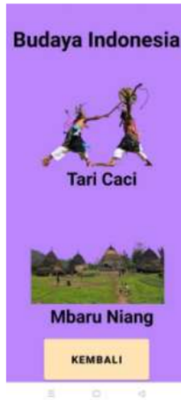
Gambar 3. Menu Budaya

Gambar 3 diatas adalah salah satu kebudayaan dan rumah adat yang ada di Indonesia yaitu Tarian Caci dan Rumah Adat Mbaru Niang yang berasal dari Nusa Tenggara Timur (NTT) lebih tepatnya daerah Manggarai.