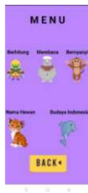
Gambar 2. Tampilan Menu