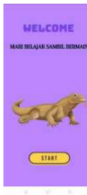
Gambar 1. Tampilan Dashboard

Aplikasi Marbelin menggunakan karakter karakter yang berhubungan dengan kebudayaan Indonesia serta disukai oleh anak anak. Tampilan dashboard dapat dilihat pada gambar 1 berikut.