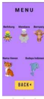
Gambar 2. Tampilan Menu