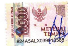
Bernadine Odelia Binti