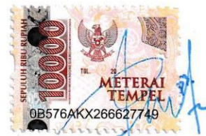
Penta Paula Potifera