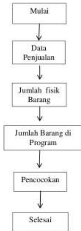
Gambar 7. Pemeriksaan Fisik Barang