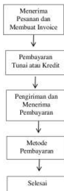
Gambar 2. Transaksi Penjualan

Ketika pesanan diterima, bagian penjualan membuat invoice memakai program PT. LTS. Pembeli melakukan transaksi pembayaran, bisa tunai atau kredit dan bagian pembelian akan mencatat pada program terkait termin yang diminta oleh pembeli. Pembayaran akan dilakukan, jika pengiriman barang sudah dilakukan oleh pihak gudang. Adapun metode pembayaran yang ada, bisa cash atau debit.