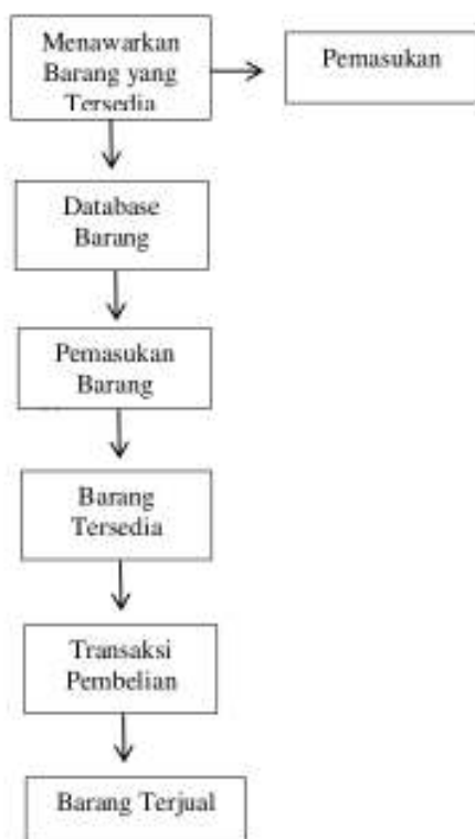
Gambar 1. Penawaran Penjualan

Bagian penjualan PT. LTS menawarkan produk barang kepada pembeli. Pembeli melakukan pemilihan barang yang diperlukan dan tersedia di PT. LTS, dicatat pada database yang ada. Pembeli melakukan transaksi, baik melalui sales atau kasir pada cabang depo PT. LTS. Pengiriman diatur sesuai rute yang sudah dibuat pada program perusahaan. Barang yang sudah laku terjual, masuk pada database barang.