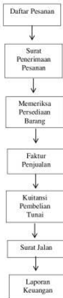
Gambar 3 dan 4. Proses Penjualan Kredit dan Tunai

Sedangkan alur penjualan tunai tampak di bawah: