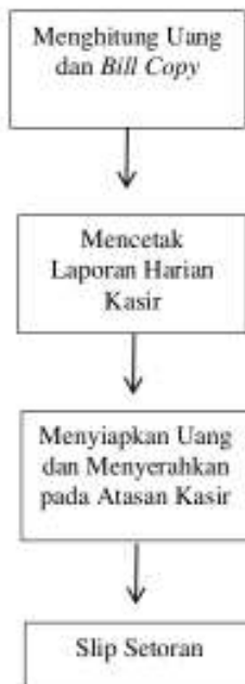
Gambar 5. Persiapan setoran uang tunai ke bank

melengkapi semua bukti transaksi dan bukti pendukung pada atasan kasir atau Admin Accounting untuk diperiksa kebenarannya.