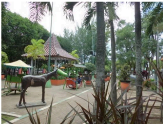
Gambar 15. Playground, sebagai fungsi baru yang masuk ke dalam Alun-alun Jember.

Alun-alun yang berada di tengah kawasan ini, dahulu merupakan ruang kosong (berupa hamparan rumput dengan beberapa pepohonan), yang hanya sesekali saja dipakai bila ada acara publik seperti pesta rakyat, atau untuk upacara.