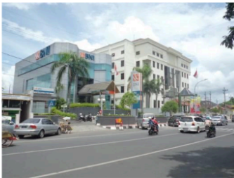
Gambar 11. Sisi Timur Alun-alun Jember dengan gedung-gedung Bank yang berupa hi-rise building (bertingkat tinggi)