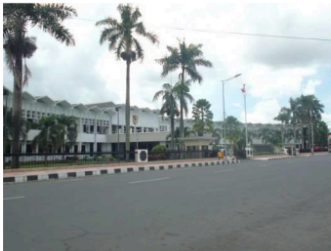
Gambar 7. Kantor Pemkab Jember di masa sekarang.