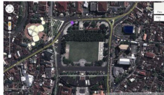
Gambar 3. Kawasan Alun-alun Jember di masa Sekarang

Seperti halnya kota-kota lain di Jawa, Jember juga memiliki sebuah Alun-alun kota yang punya ciri khas dan karakteristik tersendiri, sekaligus juga sebagai identitas kota Jember. Sebagai sebuah landmark kota, Alun-alun Jember juga menjadi representasi dari proses penguasaan dan penaklukan, pertentangan budaya, perbedaan paham dan kelas, juga jejak dan bibit kota kreatif yang terjadi sejak masa penjajahan Belanda hingga saat ini.