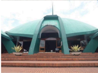
Gambar 13a dan 13b. Hybrid antara masjid tajug dan mesjid shell di sisi barat Alun-alun Jember.