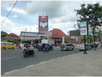
Gambar 10. Sisi Utara Alun-alun dengan berbagai macam bangunan, baik bentuk maupun fungsinya.

Bagian sisi utara merupakan sisi yang paling dinamis disorainya saat ini. Di sini tidak ada bangunan yang dominan, dan lebih terlihat sebagai kumpulan massa-massa bangunan yang berderet dan berasal dari masa (waktu) pembangunan yang berbeda-beda tetapi tidak berurutan, membentuk sebuah perjalanan historis yang acak ( random ).