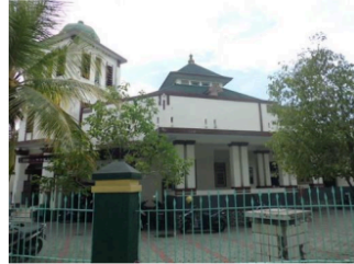
Gambar 8. Masjid Lama tajug di sebelah barat Alun-alun Jember.

Sedangkan sumbu yang kedua adalah masjid baru berupa masjid modern yang dibangun sejak tahun 1978, dengan atap shell besar yang menjadi ikon baru di sebelah barat alun-alun Jember sampai sekarang ini.