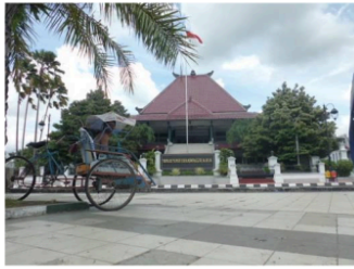
Gambar 14a dan 14b. Hybrid antara bangunan komersial dan bangunan birokratis di sisi utara Alun-alun Jember