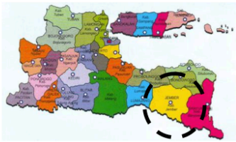
Gambar 1. Peta Jawa Timur

Kota Jember merupakan sebuah kota di Jawa Timur bagian timur yang pada awalnya dibentuk oleh pemerintah Belanda di jaman kolonial, dan dalam perkembangannya akhirnya menjadi ibukota dari kabupaten Jember sampai sekarang ini. Kota ini berkembang dari nol, dan berkembang karena banyak pendatang yang ingin mengubah kehidupan (Adisasmita, 2010), dibentuk oleh proses migrasi (Hariyono, 2007). Jember adalah salah satu kota yang cukup penting di Jawa Timur baik secara budaya, ekonomi dan politik, antara lain terbukti dari adanya perguruan tinggi negeri (Universitas Jember), juga adanya bandar udara (bandara) yang menghubungkan Jember dengan Surabaya, bahkan Jember juga punya agenda kreatif yang sudah menjadi agenda Internasional, yaitu JFC ( Jember Fashion Carnival ). Selain itu, Jember juga menjadi daerah dalam fase peralihan yang dinamis, yang berada antara desa dan kota (Pontoh dan Kustiwan, 2009)