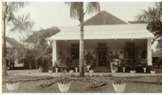
Gambar 6. Kantor Regentschap (Kantor Asisten Residen) Jember pada masa Kolonial Belanda.

Saat ini, bagian selatan adalah bagian yang paling konsisten dengan satu fungsi, yaitu sebagai kantor pusat Pemerintah Kabupaten Jember beserta kantor-kantor penunjangnya.