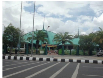
Gambar 9. Masjid Baru berbentuk shell di sebelah barat Alun-alun Jember.