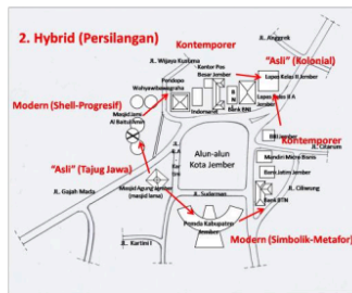
Gambar 12. Peta Hibriditas Kawasan Alun-alun kota Jember

Si penjajah berusaha mengambil sesuatu dari yang terjajah sebagai sesuatu yang "baru" (mungkin juga eksotik), sedangkan yang terjajah ingin meniru si penjajah agar dianggap sejajar/setara dan lebih maju.